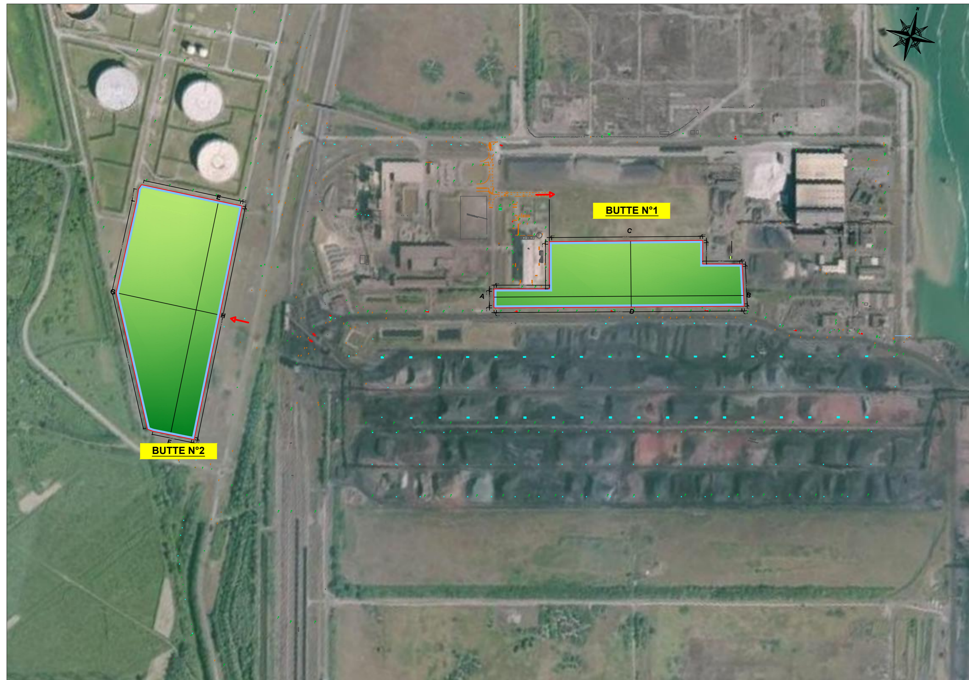
LOCALISATION DES BUTTES - 1/5000